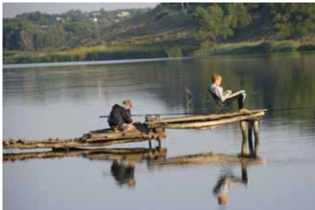
Рыбалка на озере поселка Комсомольский

Выражаем сердечную благодарность за гостеприимство и теплые встречи.